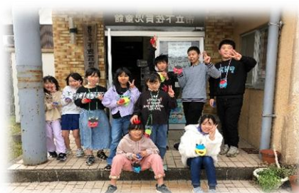
季節の行事 (節分まめまき)