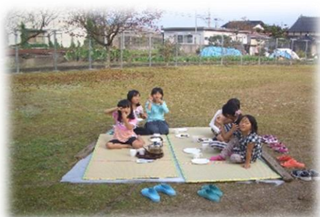
児童遊園にてお花見