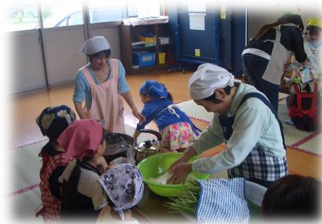
ちまき作り (三世代交流)