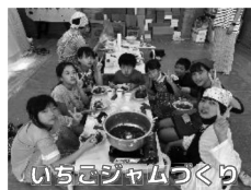
いちごジャムづくり